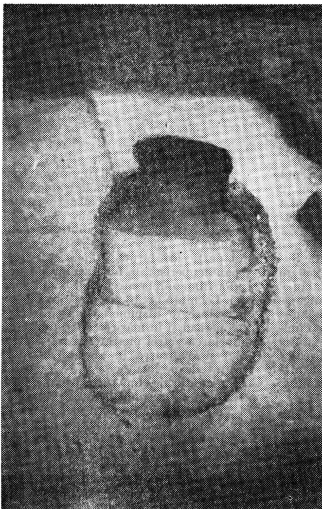
Fig. 1. Panic. Cuptorul de ars oale.